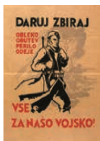
preskrba partizanskih čet

OSVOBOJENO OZEMLJE je večje ali manjše naseljeno ozemlje, s katerega je bil okupator pregnan in na katerem je oblast prevzela OF.