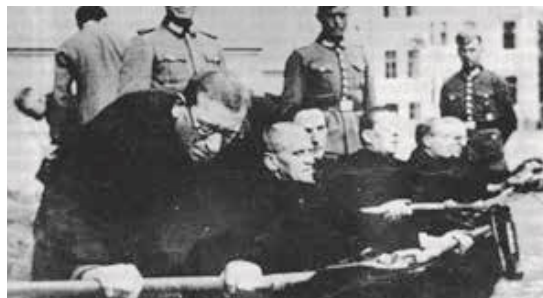
Mučenje zaprtih duhovnikov v vojašnici Melje v Mariboru

(Božo Repe, Naša doba, DZS, Ljubljana, 1995)