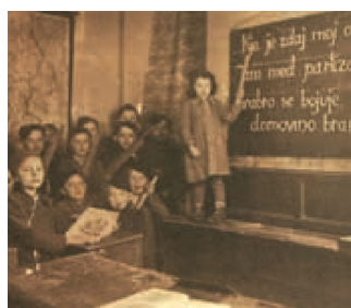
delovanje partizanskih šol