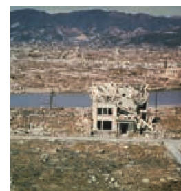
Posledice atomske bombe v Hirošimi

Ob eksploziji je veliko ljudi umrlo zaradi izjemne rušilne moči in udarnega vala, ki je nastal ob eksploziji. Zaradi visoke temperature, ki je ob tem nastala, so ljudje tudi v oddaljenih krajih dobili hude opekline. Po eksploziji je radioaktivno sevanje povzročilo hude okvare v delovanju človeškega organizma, razširjenost raka ter genske poškodbe (mutacije).