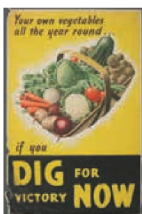
Angleški plakat pravi »Kopljite za zmago!«

B. Ob sliki zapiši: katero vojno težavo prikazuje, kako so jo skušali rešiti.