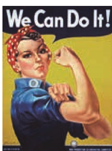
Ameriški plakat pravi »Mi lahko naredimo.«

Pomanjkanje hrane so skušali rešiti tudi s skrbnim obdelovanjem zemlje, tudi v mestih.